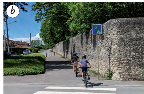
Tournez à droite sur le chemin longeant le domaine de Ripaille