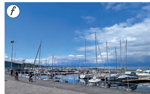
Port de Thonon (Village des pêcheurs, funiculaire pour le centre-ville)