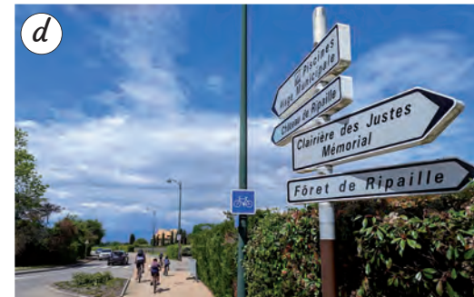
Option 2 : Suivre la route principale menant au port de Thonon