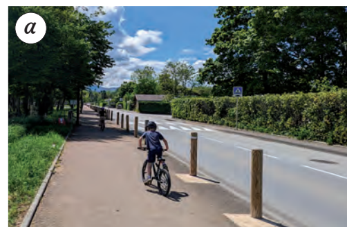
À la sortie du camping, tournez à gauche sur l'avenue de Saint-Disdille