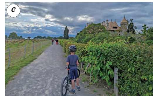
Option 1 : Sentier découverte de Ripaille - Direction forêt de Ripaille