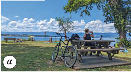
Plage du Redon