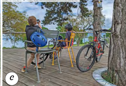
Aire de jeux du Grand Ponton