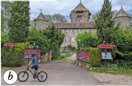
Château de Coudrée